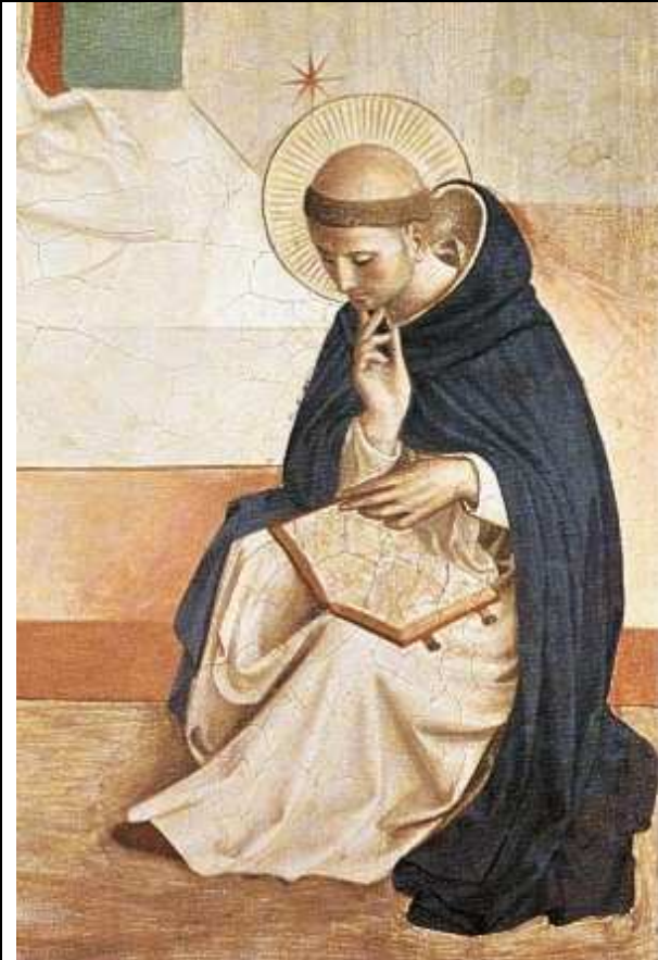
San Domenico in Preghiera – Beato Angelico